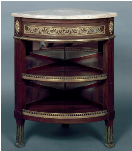
Eckkonsole, Umkreis David Roentgen, um 1785/90, Inv. A 1415

Während der systematischen Untersuchung von Sammlungsbeständen in Hinblick auf die Herkunft der Objekte, wie es das aktuelle Forschungsprojekt im MAKK zum Ziel hat, fördert die Provenienzforschung immer wieder auch Informationen ans Licht zu den beteiligten Personen, der Institutionsgeschichte und den Handelsnetzwerken, in denen die Kunstwerke zirkulieren. Diese Erkenntnisse aus dem Bereich der Kontextforschung, in die der Beitrag einen kleinen Einblick geben möchte, tragen maßgeblich zum Verständnis der historischen Umstände bei.