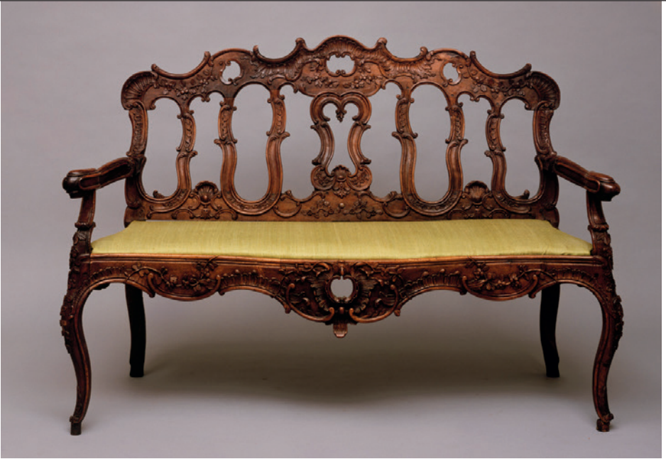
Polsterbank, Rheinland (Mittelrhein), 1750–60, Inv. A 1405