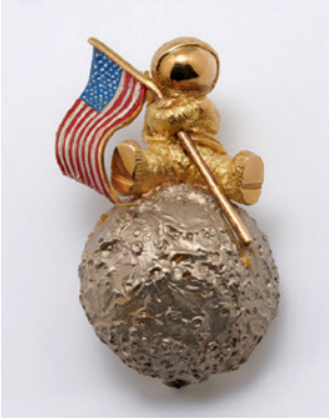
Brosche „Man on the Moon“, Freddy Wolfers