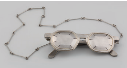
Halskette „Brille (Siegmond Reiss)“, Sawa Aso

Einige der hier aufgeführten Schmuckstücke waren dieses Jahr in der Ausstellung „Danish Jewellery Box“ zu sehen, die wegen der pandemiebedingten Museumsschließung leider nur kurze Zeit für Besucher zugänglich war. Perspektivisch wird Ihnen aber ganz gewiss die eine oder andere Neuerwerbung in der neuen Präsentation unserer Schmucksammlung begegnen, auf die wir aktuell intensiv hinarbeiten.