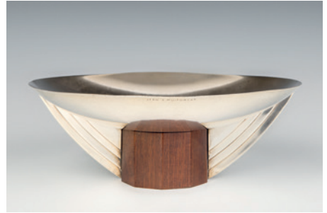
Handwaschgefäß aus dem Tafelsilber des Maharadschas, um 1932. Jean-Émile Puiforcat (1897-1945)

Außerdem war das Glück der jungen Maharadscha-Familie leider nicht von großer Dauer. Ganz plötzlich verstarb 1937 die junge Maharani während eines Schweiz-Besuchs bei einer Blinddarmoperation. Die Ehe war zwar ursprünglich – wie in Indien damals üblich – arrangiert und die beiden schon im Kindesalter verheiratet worden, aber für beide war es letztlich die große Liebe, wie man unzähligen Fotografien entnehmen kann. So erholte sich der Mahara-