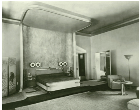
Palast Indore, Schlafzimmer der Maharani, um 1932