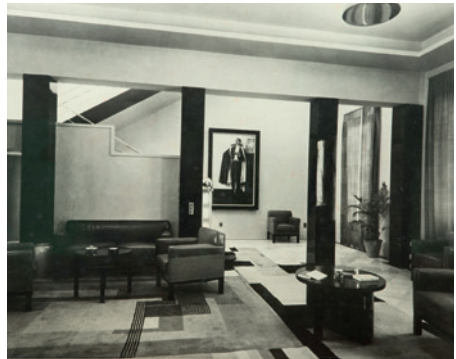
Palast Indore, Eingangshalle, um 1932

selbst einen Tiger erlegte und das Fell auf der Liege drapierte, den Transat-Chair von Eileen Gray, die Arbeitszimmermöbel von Jacques-Émile Ruhlmann, Stahlrohrmöbel und Betten (u.a. in grünem Glas) von Sognot/Alix, Teppiche von Ivan da Silva-Bruhns, Metallgefäße von Maison Desny sowie ein 600teiliges Tafelsilber von Jean E. Puiforcat. Vor der Verschiffung nach Indien wurde die gesamte Einrichtung in einer großen Ausstellung 1931/32 in Berlin gezeigt, die über 30.000 Menschen besuchten. Auch die Presse berichtete regelmäßig von diesem Projekt und brachte Artikel über den Fürstenpalast in allen Berliner Zeitungen unter Titeln wie „Ein Märchenschloss in Indien“ oder „So wohnt eine indische Fürstin“.