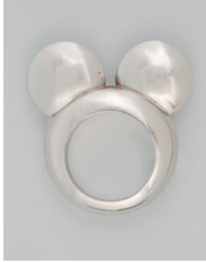
Fingerring „Faceless“, Otto Künzli