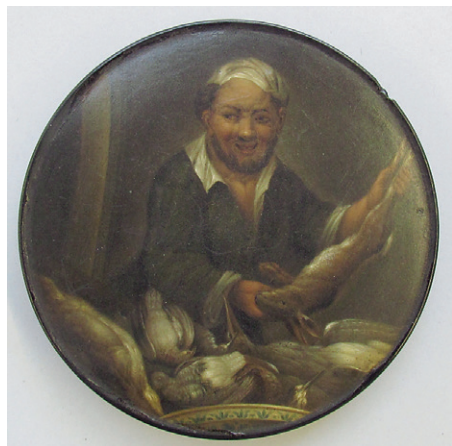
Stobwasser, Schnupftabakdose, Braunschweig, 1800-1850

senstransfer. Dies gilt zum Beispiel für die Herstellung von Lackdosen, deren Technik von Ostasien über westeuropäische Manufakturen, wie der Braunschweiger Stobwasser-Fabrik, nach Russland gelangte.