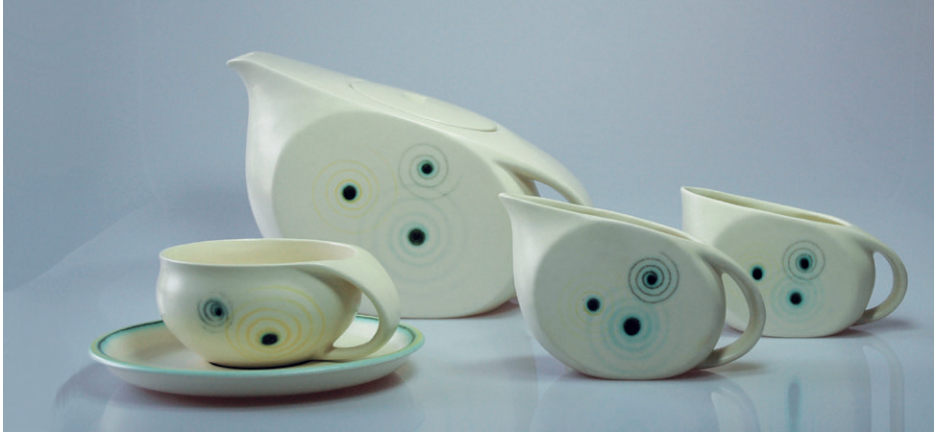
Teeservice, Marwitz, um 1929 © VG Bild-Kunst, Bonn 2016, Foto: Markanto Designklassiker