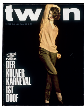
Titelblatt der Zeitschrift „tween“, Februar 1962