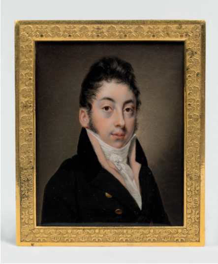
Porträt eines Herrn, Frankreich, um 1820

zu rekonstruieren, wodurch die Neugier und Fantasie des Betrachters umso stärker beflügelt wird. Diese Anregung zur Charakterschilderung gelingt nur den überaus fähigen Malern, die Ausdruck und Individualität des Porträtierten lebhaft über Jahrhunderte hinweg in ihre Werke bannen. Die Bildnisse eröffnen den Besuchern einen Einblick in die Gesellschaft während der Blütezeit der Dosenherstellung im 18. und 19. Jahrhundert. Möglicherweise zelebrierten auch die Dargestellten das Ritual des Schnupfens, zu dem eine elegante Schnupftabakdose ein unerlässliches Accessoire war.