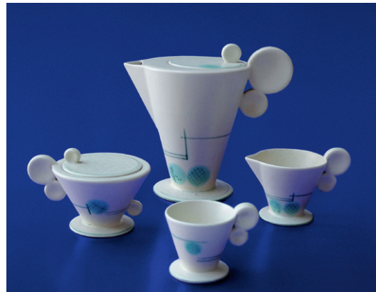
Mokkaservice, Marwitz, 1925/30