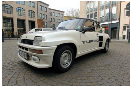
Renault 5 Turbo