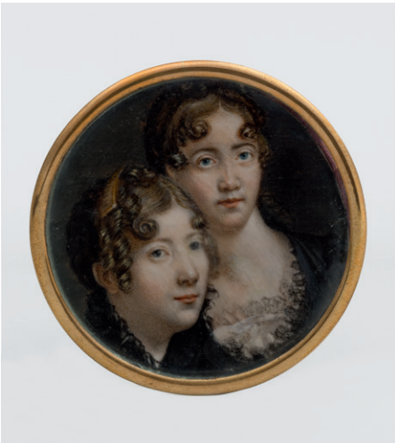
Doppelporträt, zwei Schwestern, Frankreich, um 1830