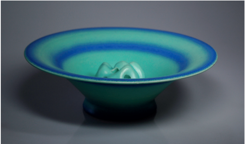
Schale mit Igeleinsatz, Marwitz, 1925/30 © VG Bild-Kunst, Bonn 2016