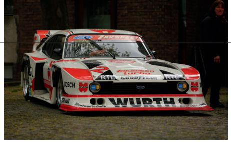
Ford Capri Turbo ZAKSPEED