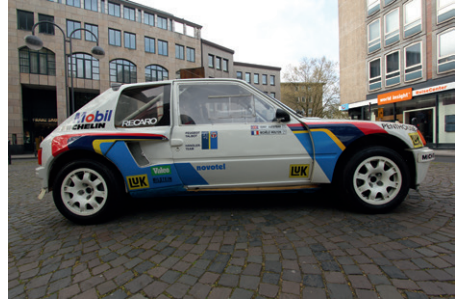
Peugeot 205 Turbo