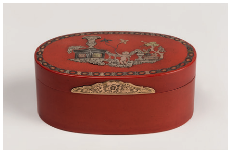
Schnupftabakdose, Paris, 1762-68