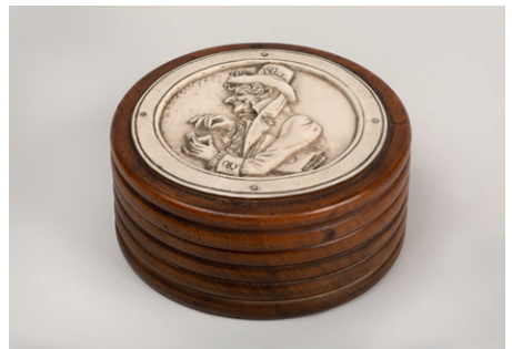
Schnupftabakdose, Deutschland, um 1830

In den Dosen, Etuis und Kassetten zeigt sich eine große Materialvielfalt. Nicht nur Edelmetalle, Edelsteine und kostbare organische Substanzen wurden bei der Herstellung eingesetzt, sondern auch weniger kostspielige Materialien wie Holz, Papiermaché und Stroh. Auf der einen Seite überzeugt diese letzte Gruppe durch ihre feine Materialbearbeitung, auf der anderen Seite finden sich immer wieder raffinierte Imitationen seltener Materialien. Diese ermöglichten es den Zeitgenossen einen bestimmten Dostentypus in weniger zahlungskräftigen Kundenkreisen zu verbreiten. Auch Etuis und Dosen aus exotischen Materialien, wie der Weberkegelschnecke und dem „Cœur de la Mer“ genannten Samen einer Lianenpflanze, überraschen den Betrachter mit ihren reizvollen Strukturen und Oberflächen. In Bezug auf die Herstellungstechniken erzählen die Ausstellungstücke eine aufregende Geschichte vom weltumspannenden Wis-