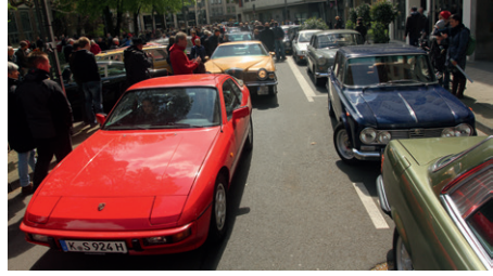
Oldtimer und Besucher rund ums MAKK