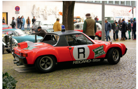
Porsche 914/6 GT